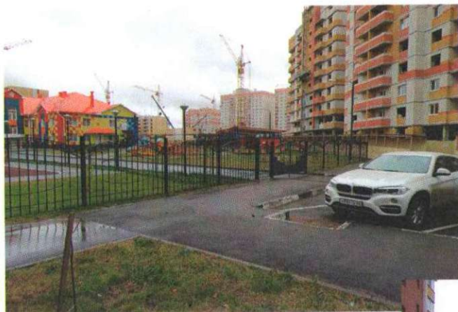
Фото на странице: 3